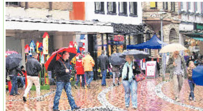
Die Besucherresonanz am verkaufsoffenen Sonntag war aufgrund des Wetters eher verhalten.

Gut besucht wurden die Einkaufszentren am Grauen Esel. Der Parkplatz am Franzosenhof, an dem Kibek, Roller, Obi und Marktkauf ansässig sind, war immer gut gefüllt. Und im Gartencenter Bellandris Rostock nutzten viele Besucher die Gelegenheit, sich mit Herbstblumen einzudecken, während die Kinder beim Laternebasteln beschäftigt waren.