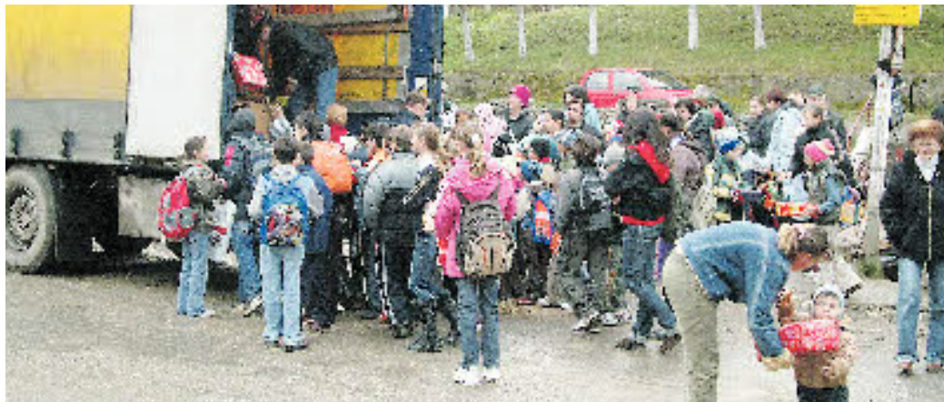
Immer ein bewegender Moment: Tabler überreichen die gespendeten Pakete an bedürftige Kinder.

Leuchtende Augen, strahlende Gesichter: Kinder, die voller Vorfreude ihre Weihnachtsgeschenke auspacken, berühren unser Herz. Um so mehr, wenn es sich dabei um bedürftige Jungen und Mädchen aus Rumänien handelt.